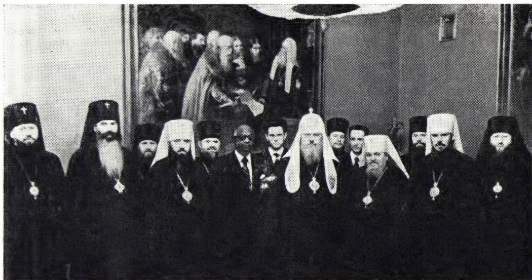
Святейший Патриарх Московский и всея Руси Пимен, сопровождающие его лица и провожающие в Московской Патриархии перед отъездом в Эфиопию 17 января 1974 г.

хам могло состояться по церковным каналам, то есть через Святейший Правительствующий Синод.